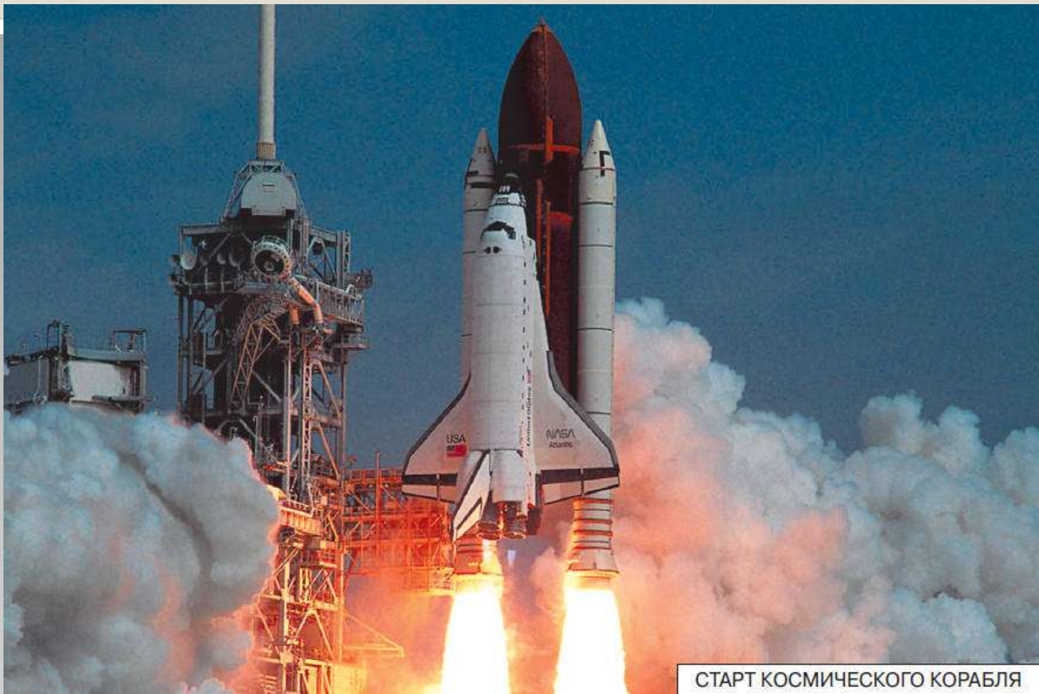
СТАРТ КОСМИЧЕСКОГО КОРАБЛЯ

Я смелая, отважная ракета, Готова я отправиться в полет. Последние мгновенья перед стартом. Вниманье! Приготовились! И взлет!